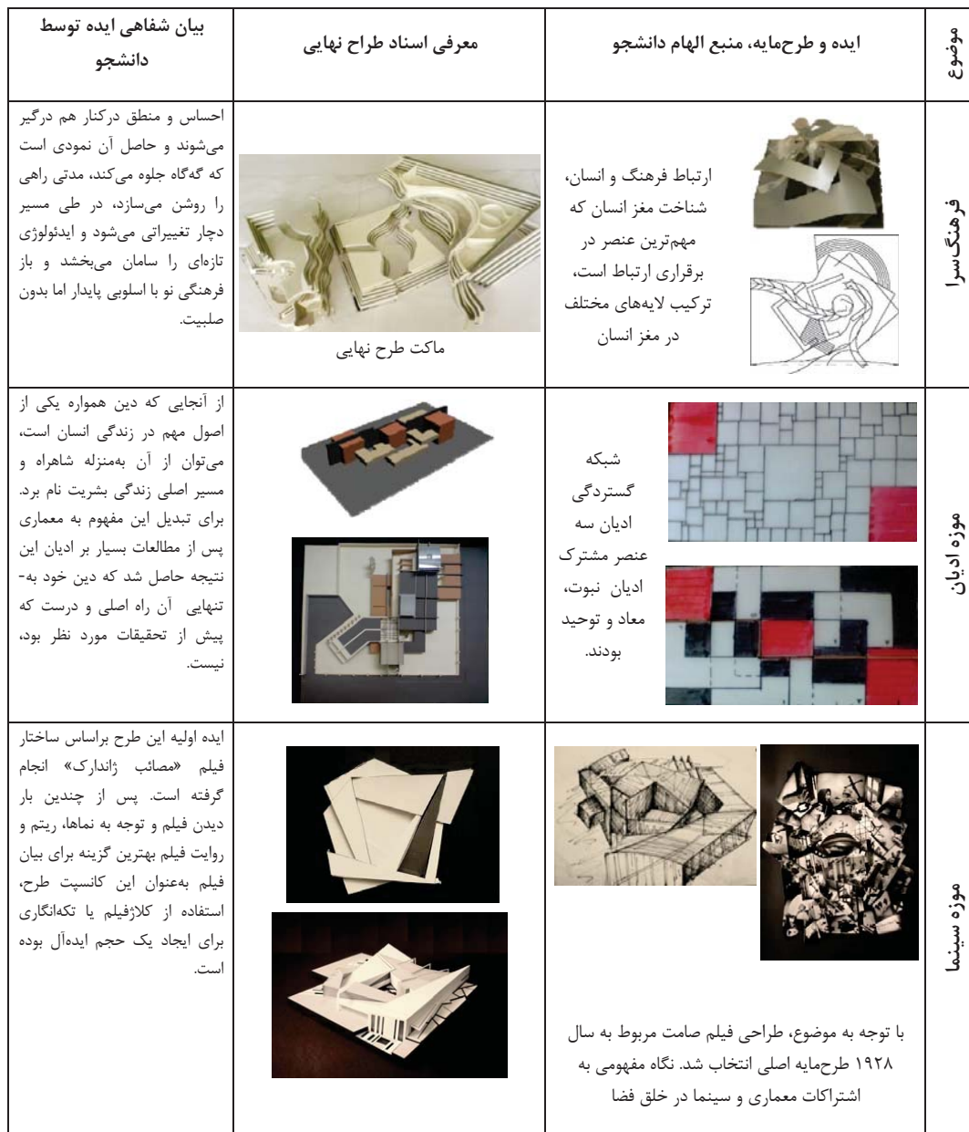
جدول ۱. نمونه فعالیت‌های دانشجویان در کارگاه‌های مورد تحقیق منتخب از کل نمونه‌ها

شفاهی دانشجویان پیرامون ایده و روند طراحی ایشان همراه بوده است. امتیاز تعلق گرفته به هر طرح اشتراک نظرات گروه داوری است. از بین نمونه‌های منتخب که به طور تصادفی و برحسب انتخاب واحد دانشجویان در کارگاه طراح معماری ۳ بررسی شدند، برخی از آنها در جدول ۱ معرفی می‌شوند: