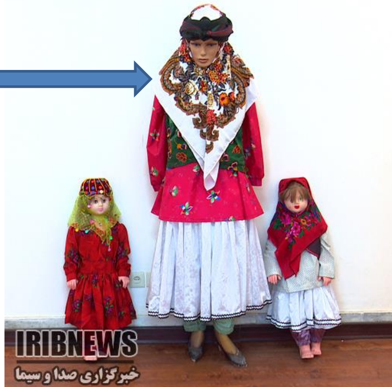
الف - ۲ - سربند

چارقند روی شانه بسته شده است چارقند (سفید و نقش دوزی)