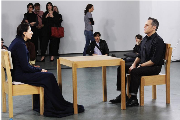
پرفورمنس تقاطع شب و دریا + مارینا آبراموویچ و اولای + ۱۲ ساعت بدون حرکت و غذا روبه روی هم نشستند