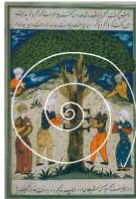
شکل ۴-۱۶: ماریچ حلزونی بکار رفته در نگاره شهادت حضرت زکریا (نگارندگان)

جدول ۲-۸: ده شهر پرجمعیت ایران (سازمان آمار ایران، ۱۳۹۰: ۱۴)