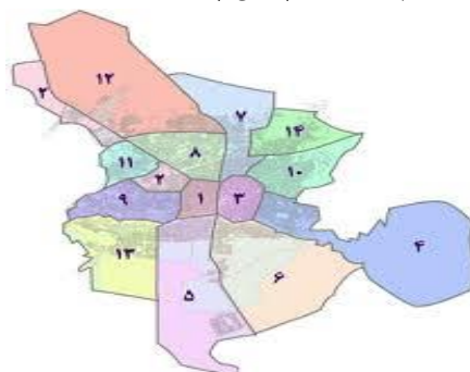
شکل ۲. نقشه مناطق پانزده‌گانه شهر اصفهان

طبق منطقه‌بندی شهرداری اصفهان از سال ۱۳۹۲، شهر به ۱۴ منطقه تقسیم شده است (شکل ۲).