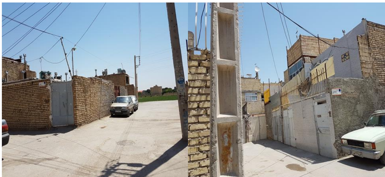
شکل (۲): وضعیت کالبدی مسکن در سکونتگاه های غیر رسمی منطقه ۱۴ اصفهان، مأخذ: برداشت های میدانی پژوهشگران، ۱۳۹۸

جدول (۷): برآورد آزمون t تک نمونه‌ای جهت مقایسه معنی‌داری هریک از عوامل در پرسشنامه تاثیر بر کیفیت و رفاه شهروندان بر مبنای زیست پذیری شهری