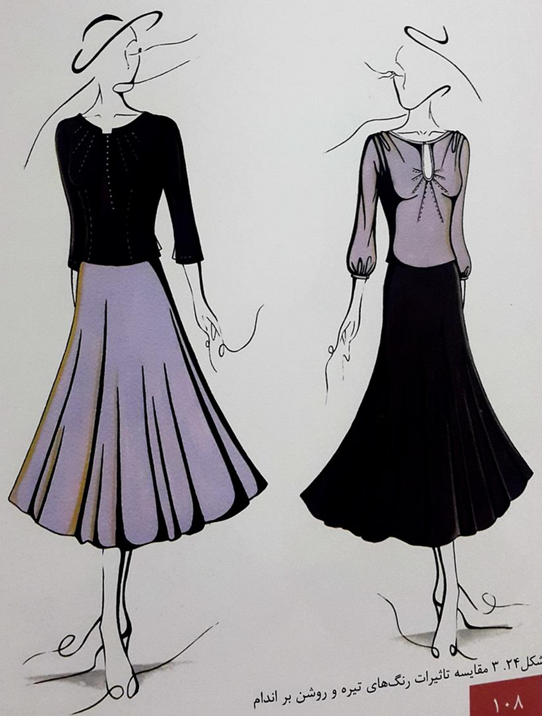
شکل ۳.۲۴. مقایسه تاثیرات رنگ‌های تیره و روشن بر اندام