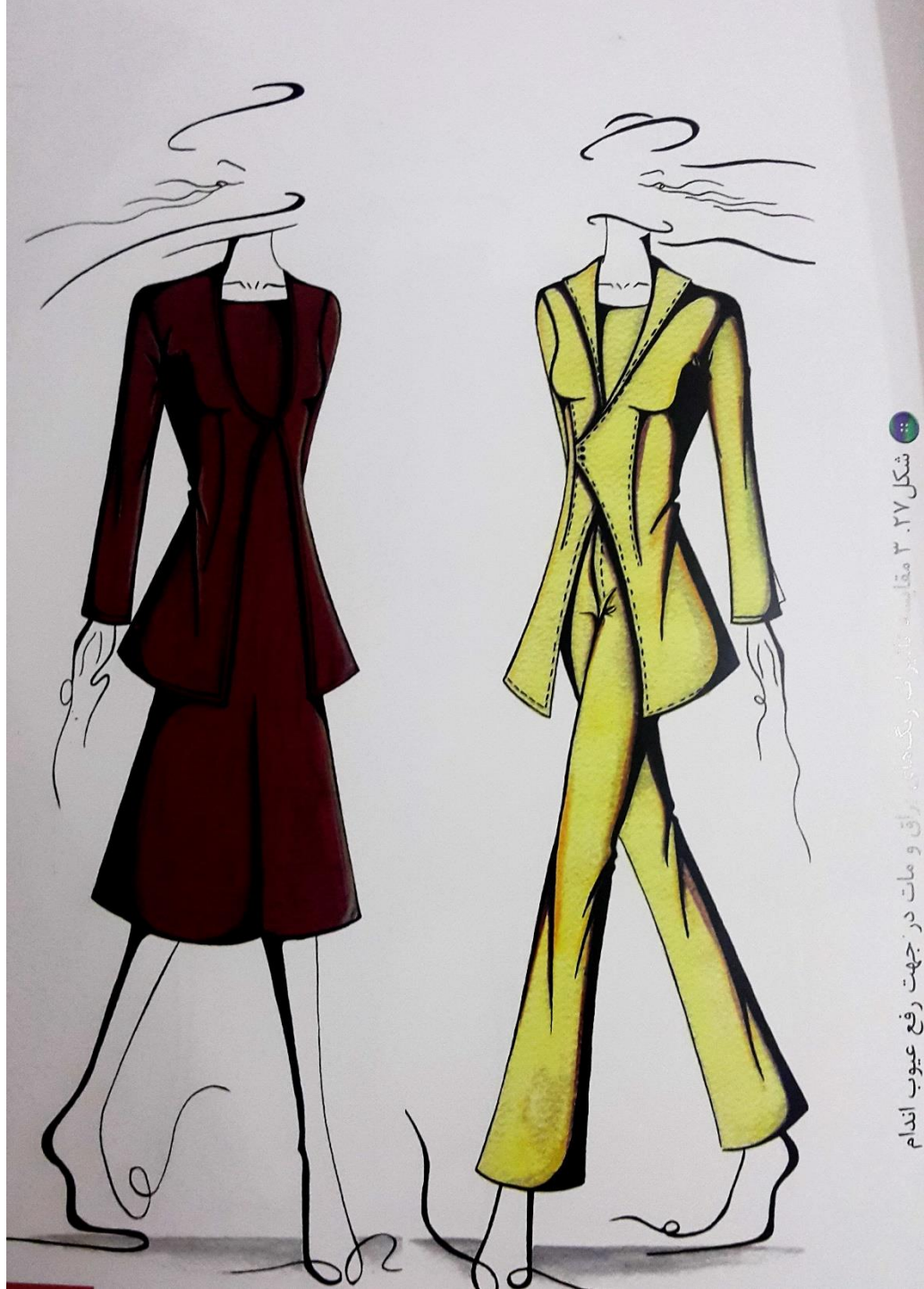
شکل ۳.۲۷ مقایسه رنگ‌های راق و مات در جهت رفع عیوب اندام