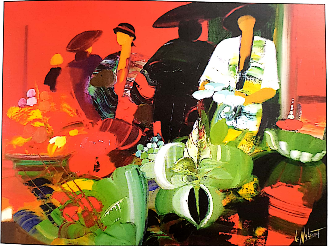
Le NALBAUT, Flarasian

این تابلو یکی دیگر از آثار مدرن و در عین حال فیگوراتیوی است که مطالعه آن می‌تواند برای یک هنرجو بسیار مفید باشد. حاکمیت رنگ قرمز در سراسر تابلو و نسبت این رنگ غالب با بقیه رنگها تقریباً نسبتی طلائی است. گردش رنگ قرمز حاکم، سیاه و زرد- نارنجی در سراسر تابلو با تنوع و ظرافت بسیار انجام گرفته است. ضمن اینکه در اجرای این اثر، هوشمندی بسیار عمیقی مشاهده می‌شود اما از فی‌البداهگی، سرعت و راحتی قلم فراوانی نیز برخوردار است. تنوع فرم‌ها، از خسته شدن چشم بیننده جلوگیری می‌کند. هنرمند برای اینکه چشم بیننده بر روی اثر به راحتی گردش کند، با شهادتی منطقی، جزئیات چهره شخصیت‌های تابلو را حذف کرده است.