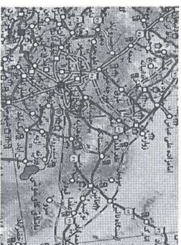
تصویر ۱: نقشه ورزشه در استان اصفهان (گیتاشناسی، ۱۳۶۲: ۱۵۶)

می‌کنند. این سنت چندصدساله در طی سال‌های اخیر تقریباً کارکرد خود را از دست داده است (ملابری ورزشه، ۱۳۷۹: ۱۳۷۹).