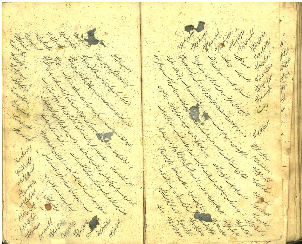
شکل دو. «حاشیه نویسی غزل‌های طالب آملی در برگ نود و شش»