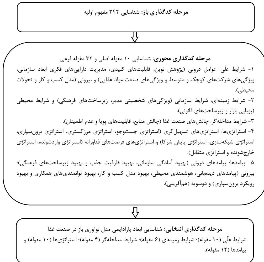
شکل ۲: فرآیند مدیریت داده‌ها و تکامل مدل در مراحل کدگذاری

289). فرآیند مدیریت داده‌ها و تکامل مدل در مراحل کدگذاری در شکل (۲) ارائه شده است: