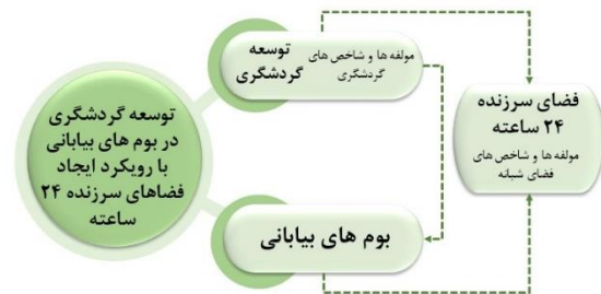
نمودار ۱: ارتباط بین مفاهیم پایه پژوهش

در پژوهش حاضر سه مفهوم گردشگری در راستای توسعه آن، بوم های بیابانی و فضاهای سرزنده ۲۴ ساعته مورد بررسی قرار گرفته است. با توجه به اینکه هدف توسعه گردشگری در بوم های بیابانی با رویکرد ایجاد فضاهای سرزنده ۲۴ ساعته می باشد ارتباطی که بین مفاهیم پژوهش شکل می گیرد مطابق با نمودار روبرو، ابتدا مولفه ها و شاخص های گردشگری استخراج می گردد، سپس شاخص های فضاهای سرزنده ۲۴ ساعته منطبق با بوم های بیابانی استخراج گردیده و سپس با توجه به ارتباط مستقیمی که گردشگری با فضاهای سرزنده ۲۴ ساعته دارد، شاخص ها به صورت مشترک پالیش می گردد و هر دو مفهوم گردشگری و فضای ۲۴ ساعته با توجه به ارتباطی که با بوم های بیابانی دارند، مسیر رسیدن به هدف را هموار می سازند.