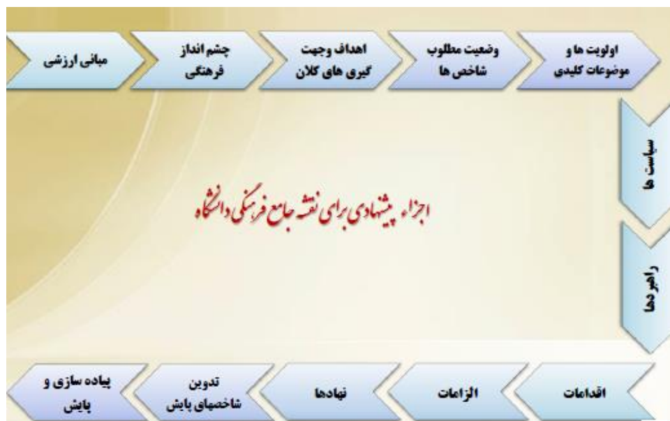
شکل ۲- فلوجارت تهیه نقشه جامع فرهنگی در هر دانشگاه